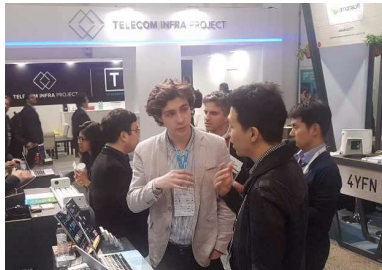
< MWC '19 @ Barcelona >