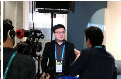
< TIP Summit '19 @ Amsterdam >