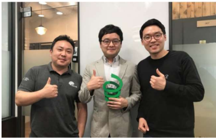
< SpringCamp >

2018년 4월 서울대학교 컴퓨터공학부 대학원 연구실 동료 세 명이 함께 네트워크디파인즈를 설립했습니다. IT전문가들이 설립한 기술기반의 스타트업인 만큼 네트워크디파인즈는 다수의 해외 저널·학회 논문 및 특허를 보유하고 있습니다. 탄탄한 팀구성과 기술력을 인정 받아 2018년 스프링캠프로부터 시드 투자를 유치 1 하였고, 2019년에는 TIPS프로그램에 선정 2 되었습니다. 또한 Facebook이 주도하는 글로벌 프로젝트 Telecom Infra Project의 엑셀러레이팅 프로그램인 TEAC서울(SK텔레콤 운영)에 참여 3 하고 있습니다.